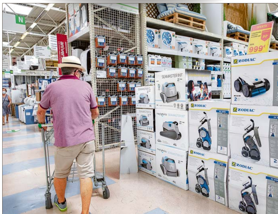
Un comprador, en Palma, en uno de los almacenes que ofrecen este tipo de piscinas.