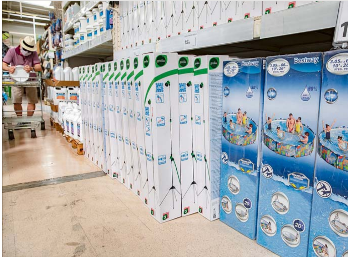
Un vecino de Palma, ante las diversas opciones que se ofertan en las tiendas.

Muchas familias se han decantado por esta opción a raíz de las noticias sobre otro hipotético confinamiento