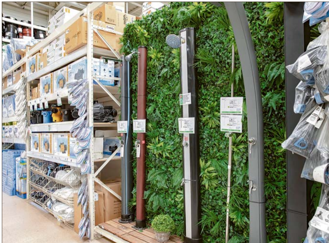
Los clientes también compran césped o pastillas de cloro para las piscinas.