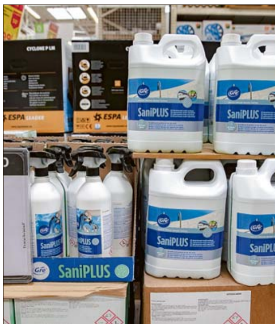
Algunos productos para el mantenimiento. B. RAMON