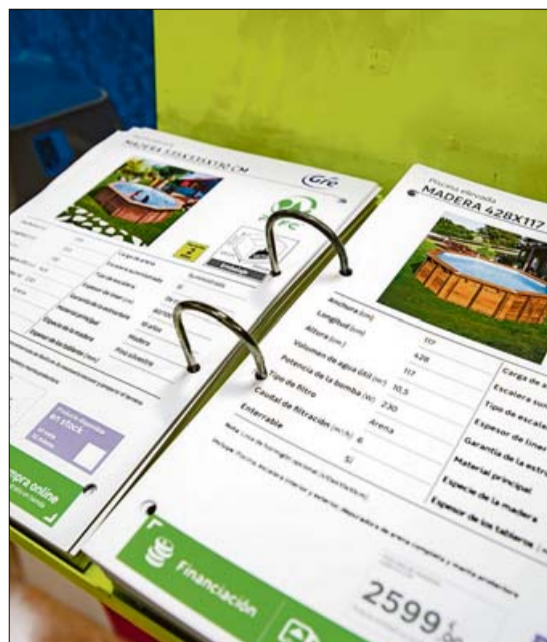
Las empresas ofrecen diversas opciones. B. RAMON

Los almacenes tienen problemas para renovar el stock a causa de la problemática generada por la pandemia