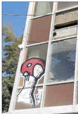
Los cristales mantendrán el mismo aspecto original.

Así, desde el COAAT explicaron que «si quieren que sea un edificio sostenible, hay que cambiar todo el envoltorio de cristal